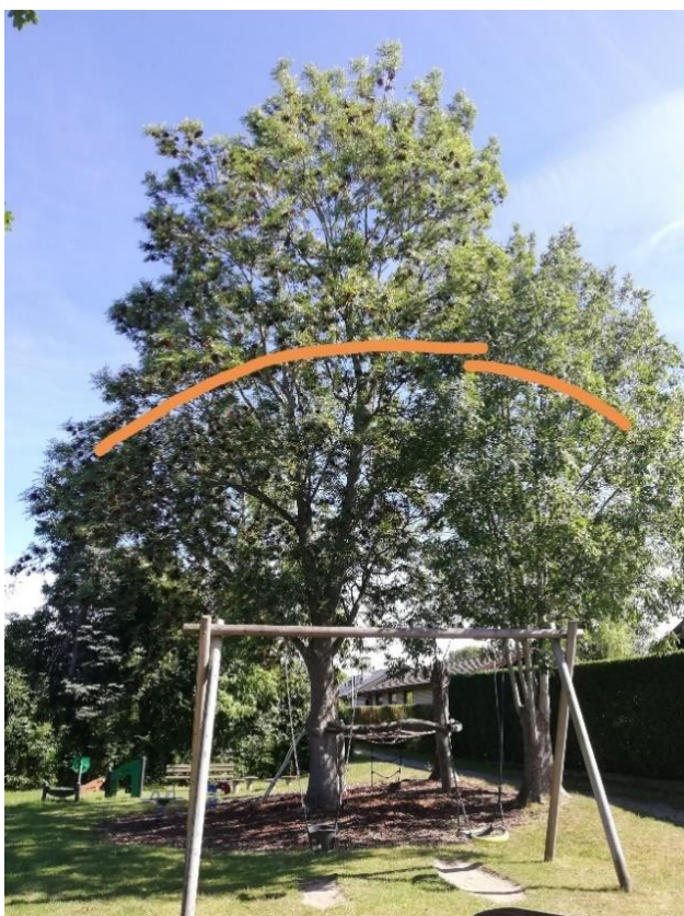
Billede 1: Beskæring af asketræerne på vestlige legeplads

Et mindre asketræ, der tidligere har været topkappet/stynet fylder for meget mod nabo. Træet reduceres 1 m i højden, så den udgør en samlet krone med det store asketræ.