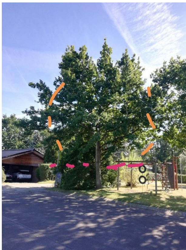
Billede 2: Beskæring af det største egetræ på østlige legeplads