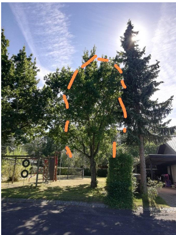
Billede 3: Beskæring af det mindste egetræ på østlige legeplads

Busket primært bestående af taks skæres ned til ca. 2m og holdes i denne højde. Se billede 3. Pink streg angiver ca. form efter dette beskæringsindgreb.