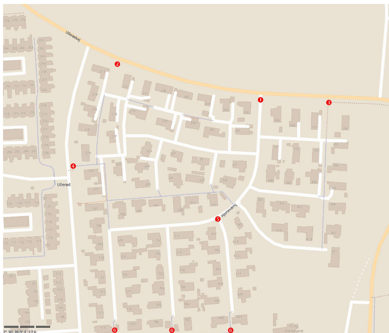
Figur 1: Oversigt over området

Grundejerforeningen for Fasanvænget er tilsyneladende ikke med i ordningen.